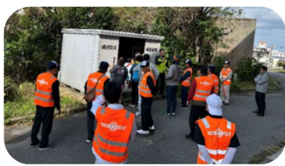
備蓄倉庫の見学と搬送訓練