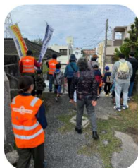
小学校への避難の様子

2/22（土）山内自主防災・防犯組織 防災訓練（山内公民館にて避難者受け入れ・公民館から山内小学校への避難訓練・山内小学校の備蓄倉庫見学・けが人などの搬送訓練・炊き出し訓練）が行われました。