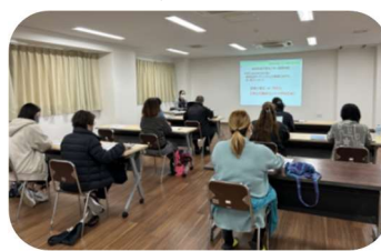
地域包括支援センター西部南の職員も講師として参加